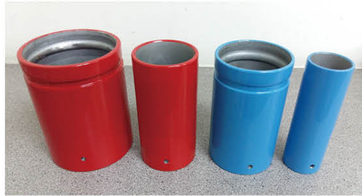
滾溝粉體塗裝用管